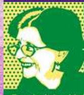
Espacio de Igualdad