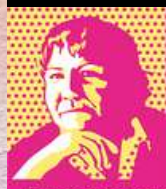
Espacio de Igualdad