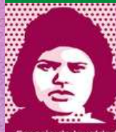
Espacio de Igualdad