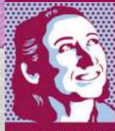
Espacio de Igualdad