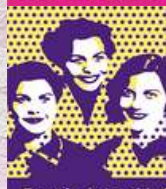
Espacio de Igualdad